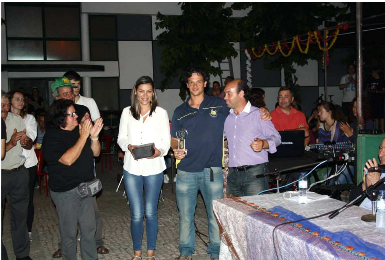
Participamos no jantar do 39º Aniversário da ACDM.